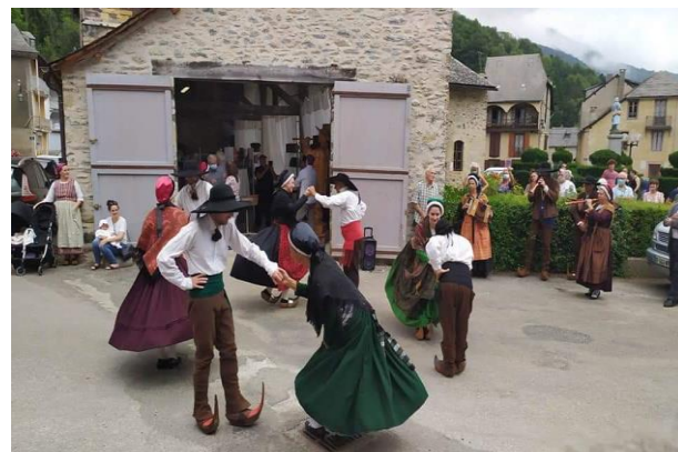
Danse des Birossans devant le porche de l'église

Une initiative à renouveler l'été prochain !