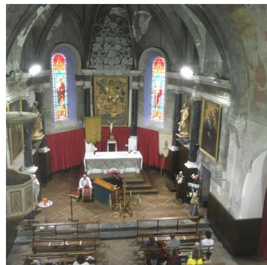
Concert en l'église