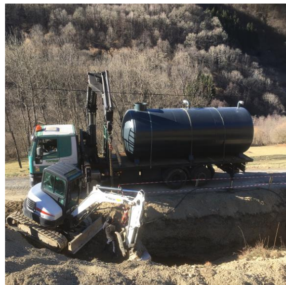
Mise en place d'une citerne incendie à Morère Rouge

L'achat d'un tracteur et d'une étrave est prévu cette année. Une fourche et un godet seront acquis en 2023.