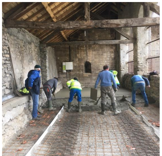
Réalisation de la dalle du porche de l'église