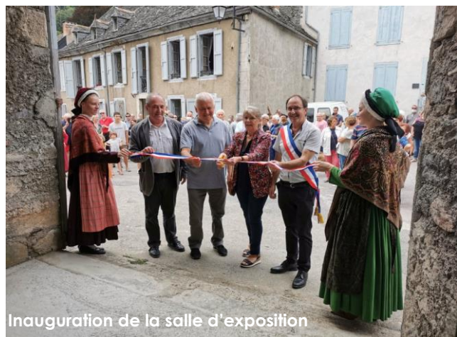
Inauguration de la salle d'exposition

Le travail de préservation du fond textile mené depuis deux ans par l'équipe en charge des costumes a permis de travailler une scénographie unique, qui se devait d'être présentée en premier lieu là où tout a commencé. Outre le travail en amont, elle est le fruit d'une collaboration entre le groupe, la mairie et des particuliers du village. Cela a été un véritable plaisir que de donner une nouvelle vie au « porche de l'église » récemment rénové. La configuration de cet espace a permis que l'exposition puisse être maintenue dans le respect des mesures sanitaires. La configuration a permis également qu'au premier jour du montage, les habitants du village viennent nous rendre visite, et reviennent parfois avec des pièces retrouvées dans leur maison afin de les mettre en lumière le temps d'un été.