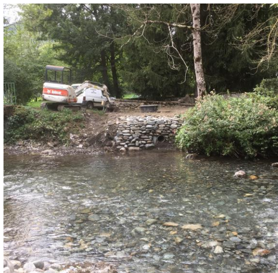
Dispositif d'alarme crue du camping