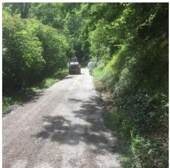
Goudronnage de la Route du Playras